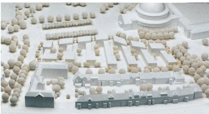
Anerkennung/Mention Steidle Architekten GmbH, München