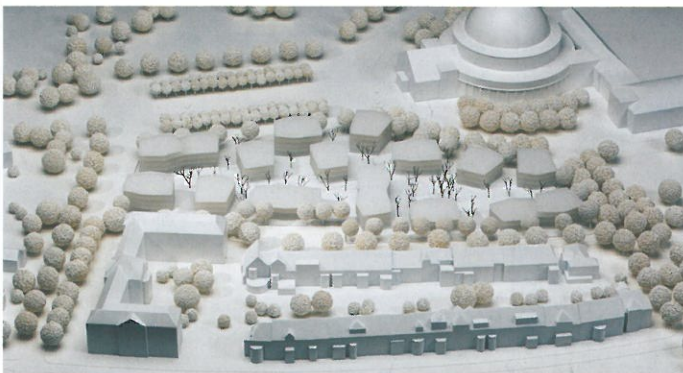
1. Preis/1st Prize Marazzi + Paul Architekten AG, Zürich

Es soll ein Bebauungskonzept erarbeitet werden, das vorrangig Wohnnutzungen enthält. Denkbar ist auch eine partielle geschossweise Mischung mit höherwertigem Gewerbe (Büros und Einrichtungen zur Quartiersversorgung) an geeigneter Stelle, das dem Wohnen deutlich untergeordnet ist. Unter diesen Gesichtspunkten werden Aussagen darüber erwartet, ob und wie sich hieraus ergebende unterschiedliche Geschosshöhenanforderungen für Büro, Gewerbe, Einzelhandel in den Erdgeschossen bzw. ersten Obergeschossen gegenüber Wohngeschosshöhen auf die städtebauliche Struktur auswirken.