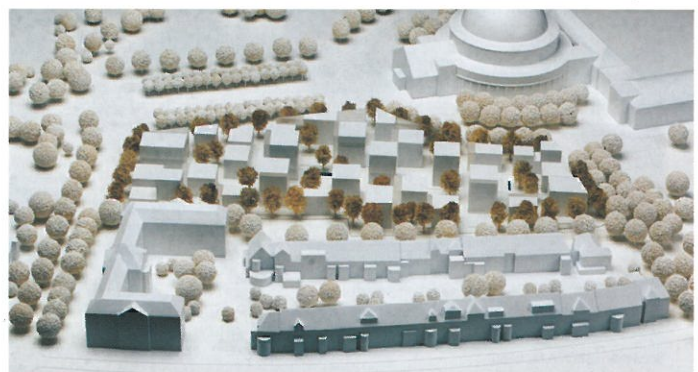
Anerkennung/Mention PFP Architekten, Hamburg