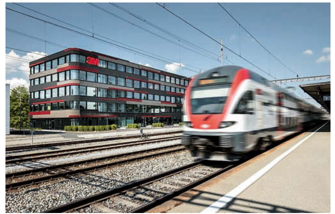
Farbkonzept mit Dynamik: die Klinkerfassade • Dynamic colour concept: the brickwork façade

Entwurf • Design Marazzi + Paul Architekten AG, CH-Zürich