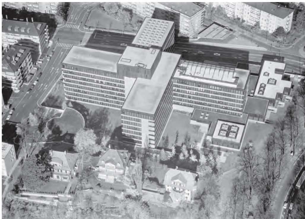
Luftaufnahme der PTT-Generaldirektion kurz nach der Fertigstellung 1970.