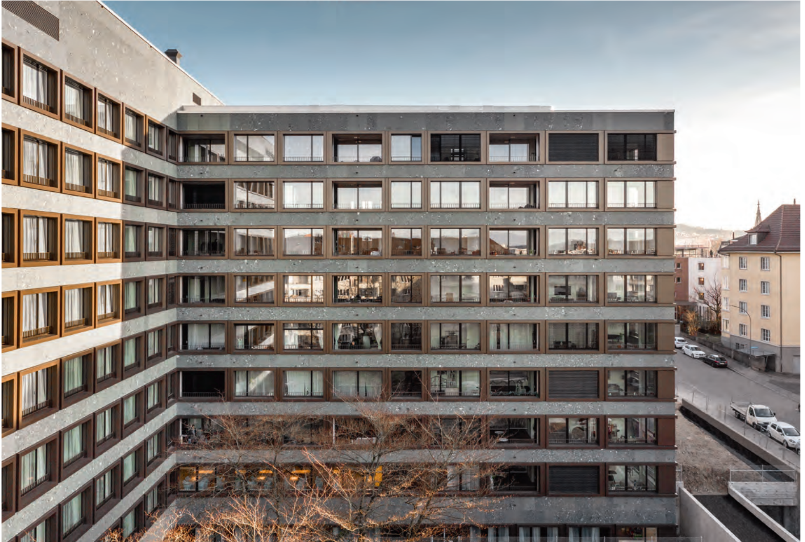
Die «Schönburg» in Bern war einst Sitz der Generaldirektion der schweizerischen PTT-Betriebe. Die neue Fassade mit Naturstein aus dem Wallis und braun eloxiertem Aluminium hat den Ausdruck des Gebäudes verändert, doch in den Grundzügen seinen Charakter bewahrt. Die Loggien sind erst auf den zweiten Blick zu erkennen.