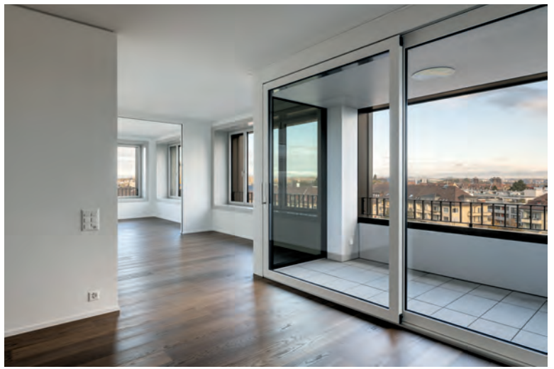
In den ehemaligen Büros der «Schönburg» sind grosszügige Wohnungen entstanden.